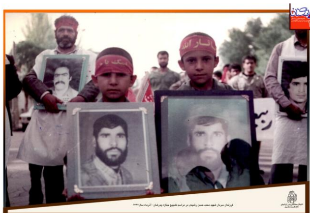
شماره‌ی یک - عکس از آرشیو بنیاد حفظ آثار و نشر ارزش‌های دفاع مقدس یزد

می‌کند، زیرا اگر بدانیم در آن تاریخ، پیکر شهدای کدام عملیات در کشور تشییع شده است، می‌توان تا حدودی به محل و عملیاتی که به شهادت منجر شده است، دست یافت. اما در پس‌زمینه‌ی عکس، دو عکس دیگر دیده می‌شود که می‌تواند موضوعی برای ارزیابی تحلیل‌گر باشد. همچنین نوع حضور فرزندان خردسال شهید در مراسم تشییع پیکر پدرشان و افراد کفن‌پوش در این مراسم، گویای روحیه‌ی مقاومت و ایستادگی مردم در آن دوران است.