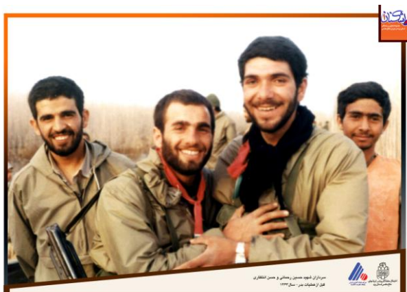
شماره‌ی ۲

نمونه‌ی دیگر، عکس شماره‌ی دو است. این عکس بی‌هیچ توضیحی، به روشنی بیانگر دوستی، رفاقت و همبستگی رزمندگان، حتی در رده‌های بالاست. شاید با هیچ نوشته‌ای نتوان به گویایی این عکس و لبخندهای این دو سردار شهید، شادابی رزمندگان را قبل از عملیات مهم بدر نشان داد. پرواضح است این عکس نشان‌دهنده‌ی شجاعت و شهادت‌طلبی رزمندگان در عملیات بدر است که به سادگی از بطن عکس خوانش می‌شود. اینها تفسیر و تحلیل تحلیل‌گر است، اما با قرار دادن این عکس در کنار خاطرات رزمندگان از حماسه‌ی عملیات بدر، می‌توان صحت این تحلیل را به اثبات رساند.